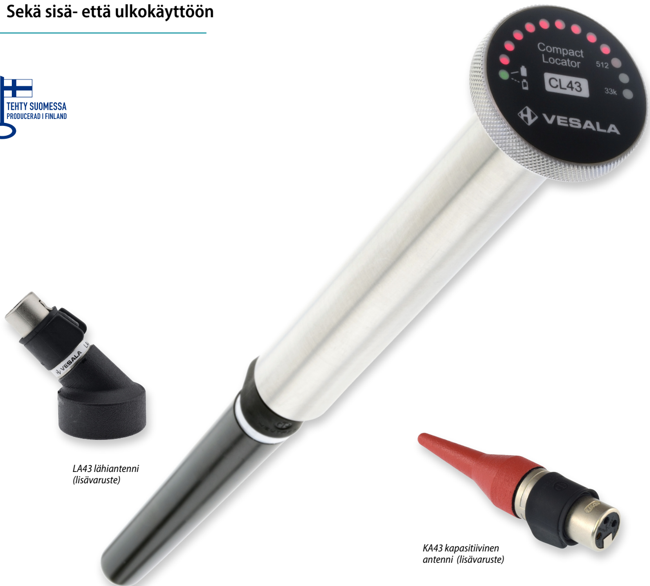
LA43 lähiantenni (lisävaruste)